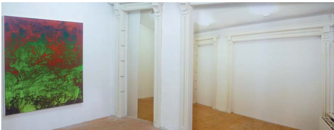
K09 - september 2012, vlnr: Martijn Schuppers, Mark van Overeem

In het van Abbemuseum in Eindhoven is momenteel nog een monumentale schildering te zien van zijn hand, waarover in de zaterdageditie van 8 september van het dagblad Trouw een vier pagina's groot artikel verscheen.