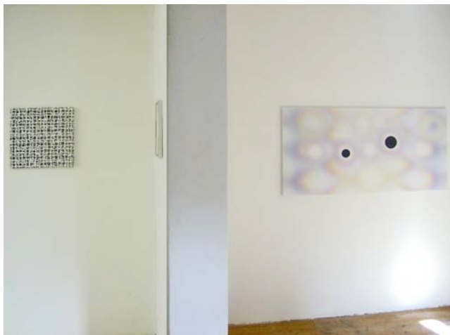
K09 september 2007 v.l.n.r. Jerry Keizer, Roland Schimmel

Een nestor van de constructivistische, concrete kunst in deze expositie is Bob Bonies (Den Haag). Onlangs waren we op zijn atelier (zeg maar gerust ateliers) en daar hing een ruim exposé van werk van de afgelopen 40 jaar. Daar krijgt men ook inzicht in het procédé, dat begint met ruitjespapier en via kleine 'prototypes' resulteert in groot werk. Recent werk was ogenschijnlijk nog eenvoudiger van opzet dan voorheen, maar tegelijkertijd ook zeer dynamisch. (Ook een kunstenaar die al zo'n 40 jaar met een elementair basisgegevens werkt kan weer verrassen). In de expositie CM-3 hing werk van een exponent uit een jongere generatie constructivisten (Jan Maarten Voskuil). Ook dit werk wordt van te voren 'uitgedokterd' en daarna geconstrueerd. Omdat deze werken uit losse elementen bestaan kunnen ze, naar believen, op allerlei manieren in elkaar worden gezet. De opvattingen van Voskuil zijn minder streng en wellicht geldt dit aspect sowieso voor jongere generaties.