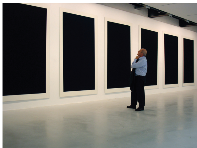
Kees Visser Quimper 2007 Acryl op Saunders Waterford 300 grs. op dibond 270 x 150 cm.